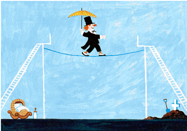
Billedet Fra vugge til grav (Linedanseren) af Storm P.

Så er der smerte. Og så kan man spørge sig selv, hvorfor Gud ikke bare har sat en sikkerhedslinje i os, så vi ikke falder af linen? Der vil være smerte men også kærlighed, når man vover sig ud i livet, for de er begge en del af livet. Hvis vi hele tiden vil være på den sikre side, aldrig risikere noget eller altid være helt rigtige, ja så ender vi med at blive så forsigtige, at vi ikke elsker, ikke har mod til at være menneske og leve det liv, vi har fået af Gud. Det er en stor tiltro Gud