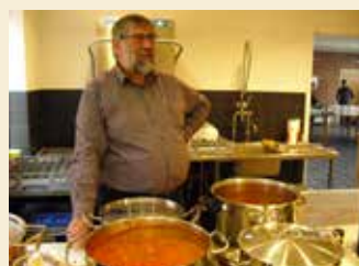
Bent har lavet kodsøvs til alle godnathistorier i 6 år!

Vi lægger puderne frem på gulvet, synger en sang og tænder fortællelyset. Så er alle ører åbne for en ny historie. Bagefter er der aftenmad i sidehuset med børnevenlig menu. Det koster ikke noget, og der er ingen tilmelding.