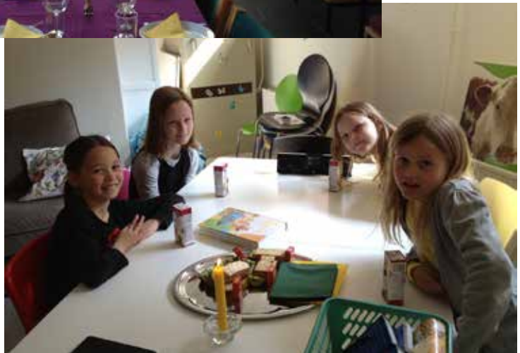
Heltindeklubben studerede bibelens seje heltinder!