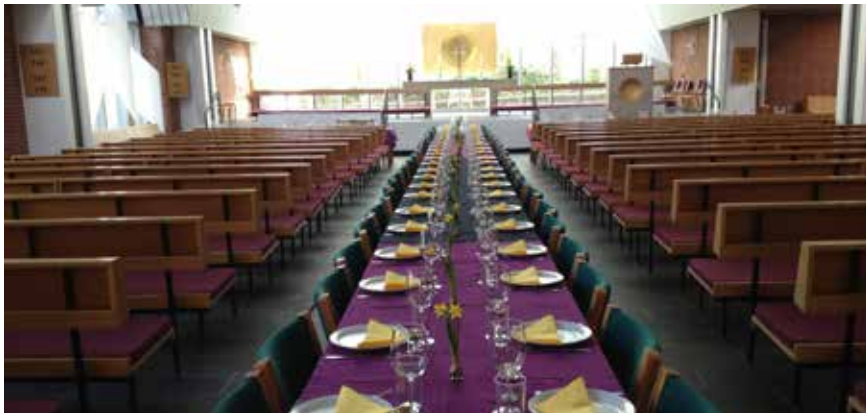
Bordet var dækket til 150 Skærtorsdag.